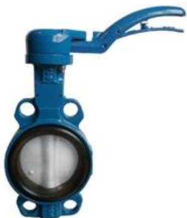
Fig. 174 GY Vlinderklep met RVS Blad voor Water